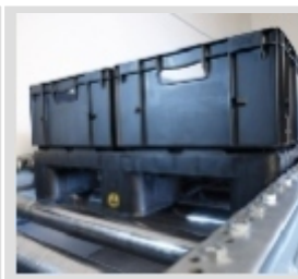
der rulliņu konveijeram